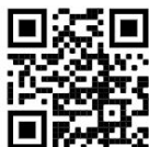
GS1 QR Code