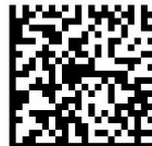
GS1 Digital Link