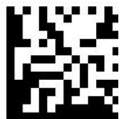
GS1 Data Matrix